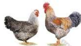
Bielefelder Kennhuhn kennesperber 1.2 jung