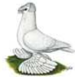
Deutsche Doppelkupp. Trommeltaube weiß 1.1 alt