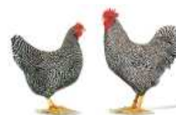
Amrocks gestreift 1.2 jung