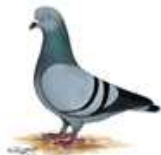
Altenburger Trommeltaube blau m.schw.Binden 1.1 alt