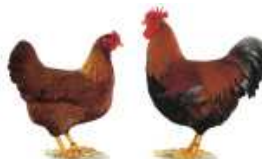
Welsmer rost-rebhuhnfarbig 1.2 jung