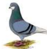
Amsterdamer Bärtchentümmeler blau m.schw.Binden 1.1 jung