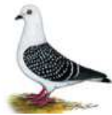
Eistaube gehämmert 1.1 jung