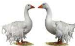
Lockengänse weiß Jarchow, Norbert

1.1 jung 3 hv 96 hv 96 LVP Seißelberg Otto