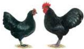
Zwerg-Australorps schwarz Jarchow, Norbert 1.2 jung 12 sg 95 hv 96 SE2 Wolf Bernd