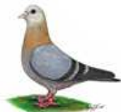
Arabische Trommeltaube weiß 1.1 jung