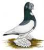
Märkische Elstern OCR 4.4 jung