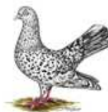
Orientalische Roller schwarz 1.1 alt