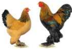
Zwerg-Brahma silberfarbig-gebändert 1.2 jung