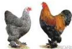
Brahma gelb-schwarzcolumbia 1.2 jung