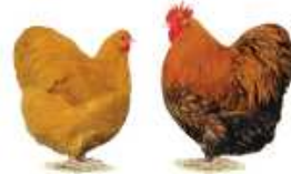
Orpington gelb 1.2 jung