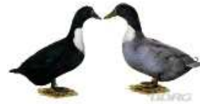
Pommernenten schwarz 1.2 jung