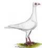
Stralsunder Hochflieger weiß 1.1 jung