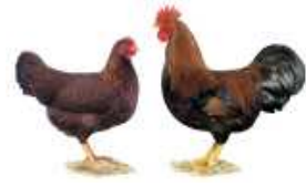
Zwerg-Welsamer rost-rebhuhnfarbig 1.2 jung