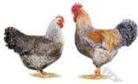
Bielefelder Kennhuhn kennesperber 1.2 jung 8 sg 95 g 91 Hellwig Joachim