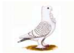
Altorientalische Mövchen Satinetten m.Spiegelschwanz blau m.w.Bd.