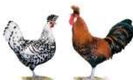
Appenzeller Spitzhauben gold-schwarzgetupft 1.2 jung