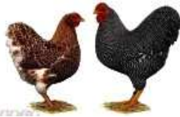
Zwerg-Wyandotten silber-schwarzgesäumt 1.2 jung