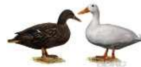
Hochbrutflugenten wildfarbig 1.1 jung