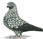
Deutscher Schautippler schwarzgetigert 1.1 jung