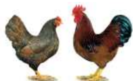
Zwerg-Barnevelder braun-doppeltgesäumt 1.2 jung 13 g 91 sg 93 Müller Heinz