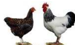
Sussex weiß-schwarzcolumbia 1.2 jung