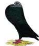
Hessischer Kröpfer blau m.schw.Binden 1.1 alt