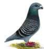
Show Racer rotfahl-gehämmert