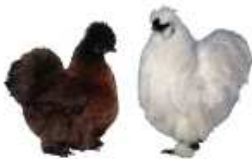
Zwerg-Seidenhühner m.Bart wildfarbig 1.2 jung