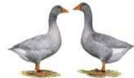
Fränkische Landgänse blau 1.1 jung

1.1 jung 3 hv 96 hv 96 LVP Seißelberg Otto