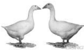
Deutsche Legegänse weiß 1.1 jung