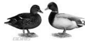
Zwergenten silber-wildfarbig 1.2 jung