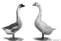
Höckergänse graubraun 1.1 jung