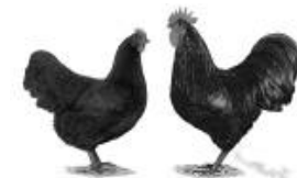
Australorps schwarz 1.2 jung