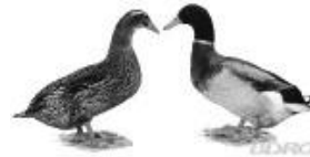
Rouen Clair-Enten . 1.2 jung