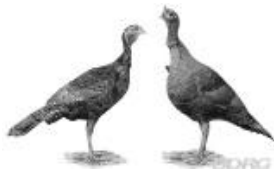
Puten Rotflügel Hans-Leopold Leesch 1.1 alt