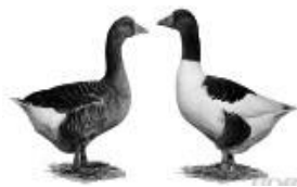
Pommerngänse grau 1.1 alt