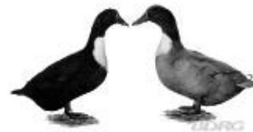
Pommernenten blau 1.2 jung